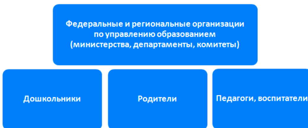
Рисунок 1. Участники образовательных отношений

ФГОС ДО регулирует отношения между участниками образовательных отношений. Кто участвует в образовании, смотрите на рисунке 1.