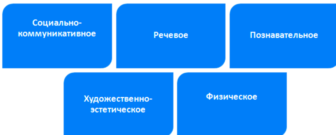
Рисунок 5. Пять направлений развития дошкольника

ФГОС ДО – это стандарт развития дошкольников. В отличие от школьных стандартов, ФГОС ДО не требует от сада оценивать подготовку и знания воспитанников. Никаких промежуточных или итоговых аттестаций детский сад не проводит. Цель работы по ФГОС ДО – подготовить ребенка к школе. Для этого его нужно развивать по пяти направлениям (рисунок 5).